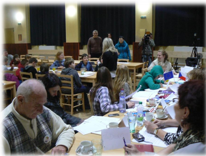
SEMINÁŘ „NOVÁ MÉDIA“ V MALENICÍCH

Zdroje financování: Operační program Vzdělávání pro konkurenceschopnost, MŠMT