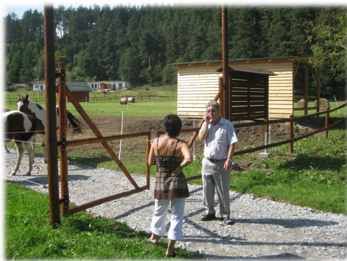
INSTALACE HIPOZASTAVENÍ SRPEN 2012

Zdroje financování: Regionálního operačního programu NUTSII Jihozápad