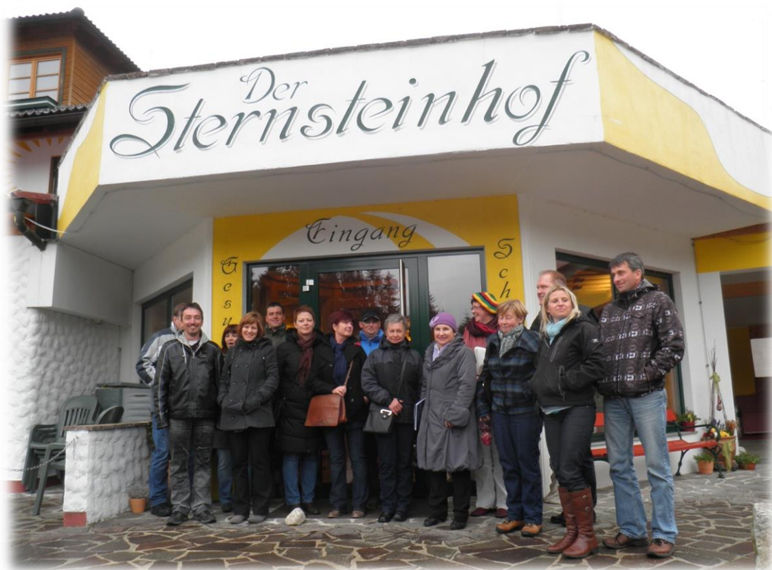
EXKURZE V RAKOUSKU V RÁMCI KURZU „MARKETING V CESTOVNÍM RUCHU“

Zdroje financování: OP Vzdělávání pro konkurenceschopnost