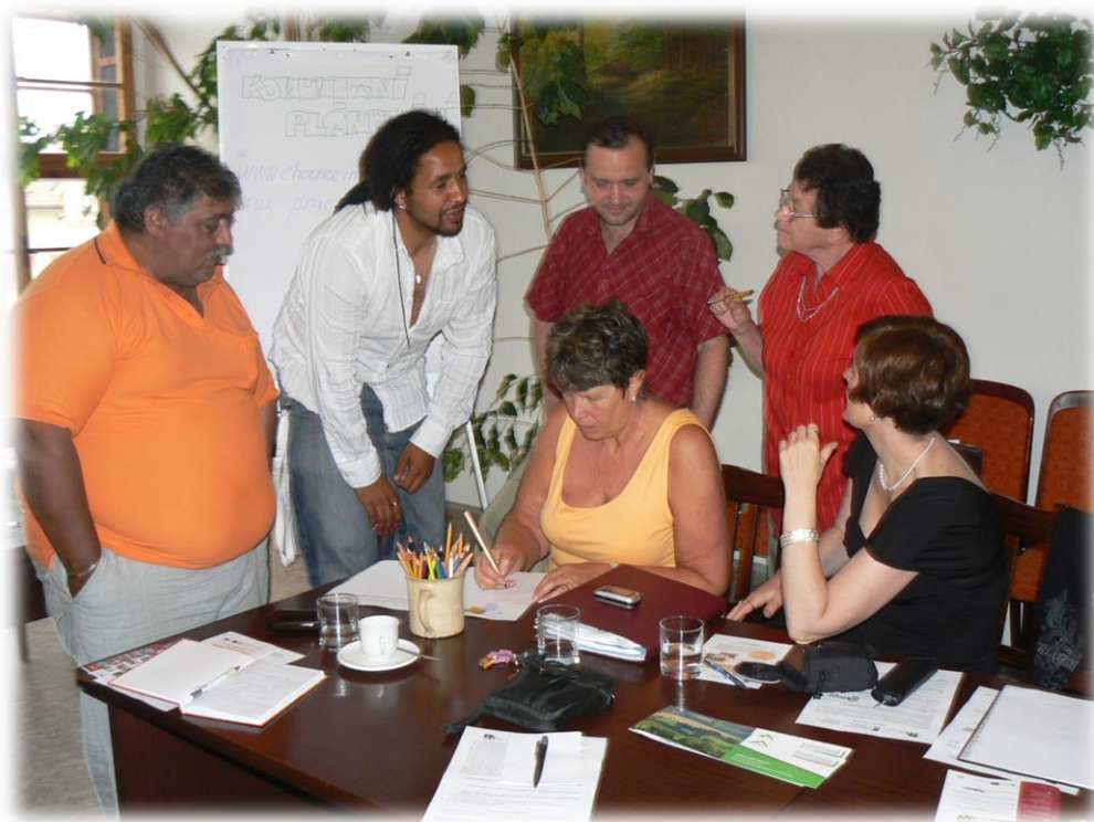
1. VEŘEJNÉ PROJEDNÁNÍ 1. ČERVNA 2012

Zdroje financování: z prostředků ESF prostřednictvím Operačního programu Lidské zdroje a zaměstnanost a státního rozpočtu ČR